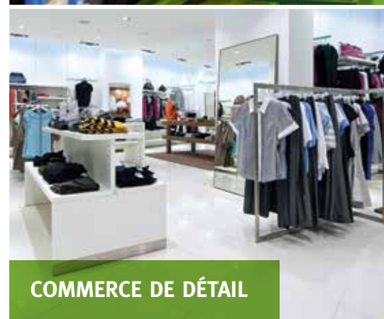
COMMERCE DE DÉTAIL